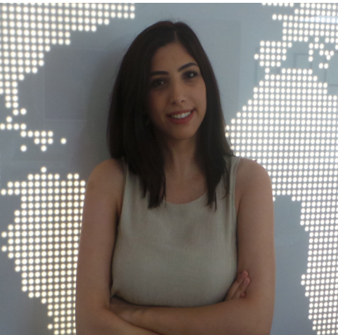
Hacer Genç Satış Sorumlusu

Galva Metal'i kendimce araştırma yaparken buldum ve bu kadar genç bir firmanın, kurulduktan çok kısa süre sonra ihracat alanında üst sıralara oynadığını gördüm. Ve buda heyecanımı oldukça arttırdı. Şirketin ihracat bölümüne personel alımı yapacağını duyunca bu fırsatı kaçırmamam gerektiğini fark ettim. Dinamik kadrosunun bana katacaklarını düşündükçe, aramızda oluşacak olan uyum ile büyük işler başarabileceğimize eminim.